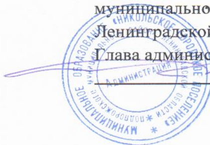
СХЕМА ТЕПЛОСНАБЖЕНИЯ МУНИЦИПАЛЬНОГО ОБРАЗОВАНИЯ «НИКОЛЬСКОЕ ГОРОДСКОЕ ПОСЕЛЕНИЕ ПОДПОРОЖСКОГО МУНИЦИПАЛЬНОГО РАЙОНА ЛЕНИНГРАДСКОЙ ОБЛАСТИ» НА ПЕРИОД С 2024 ДО 2034 ГОДА